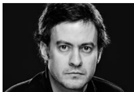
Pedro Yagüe Iluminación