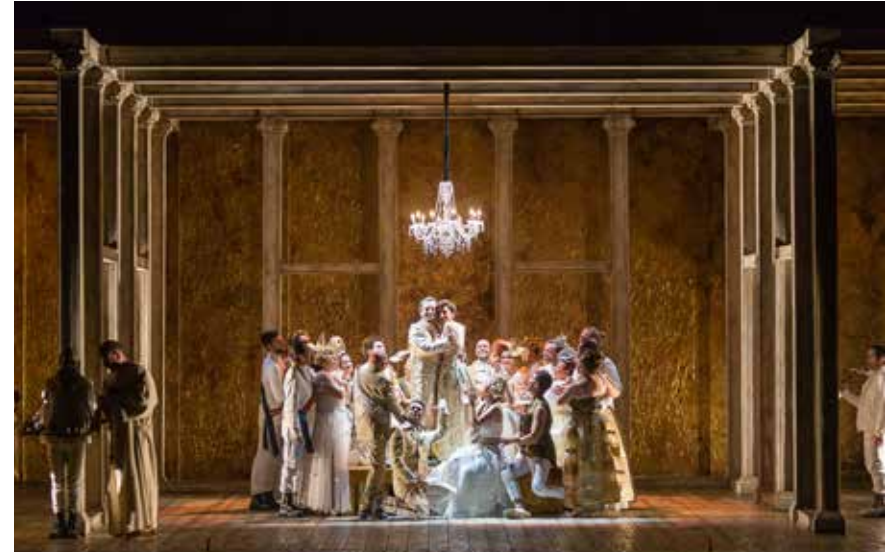
Fotografía del estreno de la producción de Don Gil de Alcalá en el Teatro Campoamor, 2017.

El n.º 14 –a cargo de Maya y Chamaco– es un jarabe mexicano, una de las danzas más populares del país azteca. Penella explotará todas sus posibilidades insitiendo sobre un patrón rítmico corchea-dos semicorcheas para acentuar el carácter bailable de la pieza. En este segundo acto destacamos, asimismo, el antagonismo musical entre los pretendientes por el amor de Niña Estrella.