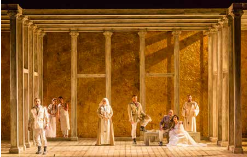
Fotografía del estreno de la producción de Don Gil de Alcalá en el Teatro Campoamor, 2017.

Los números 5 y 6 suponen la puesta de largo de Don Diego y Don Gil, respectivamente. La enérgica personalidad del primero –simbolizada mediante el uso de crescendos y ascendentes líneas melódicas– contrasta a la perfección con el intimismo del aria de Don Gil, donde destacamos un recurrente diseño motivico en la cuerda grave en un intento de plasmar la sensación de calma que el protagonista masculino quiere trasladar a su amada.