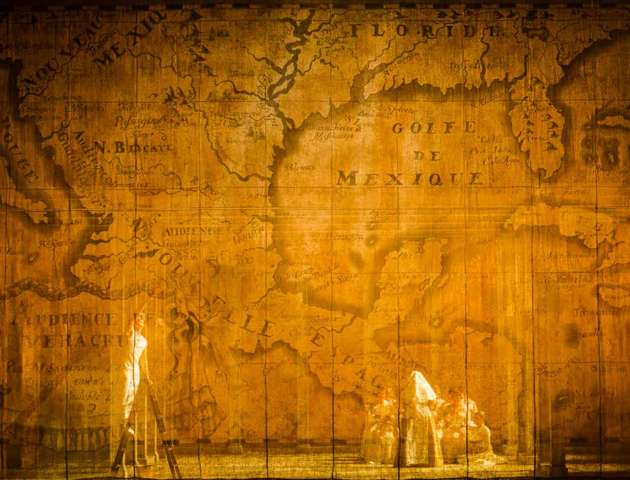
Fotografía del estreno de la producción de Don Gil de Alcalá en el Teatro Campoamor, 2017.